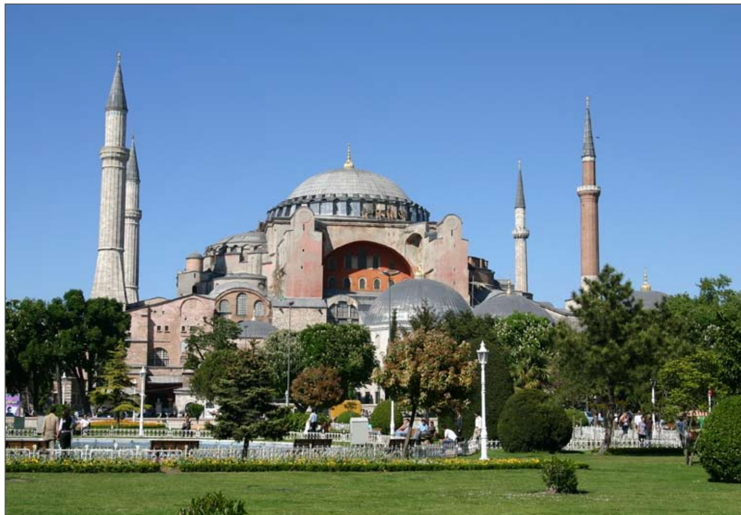
Die Hagia Sophia heute