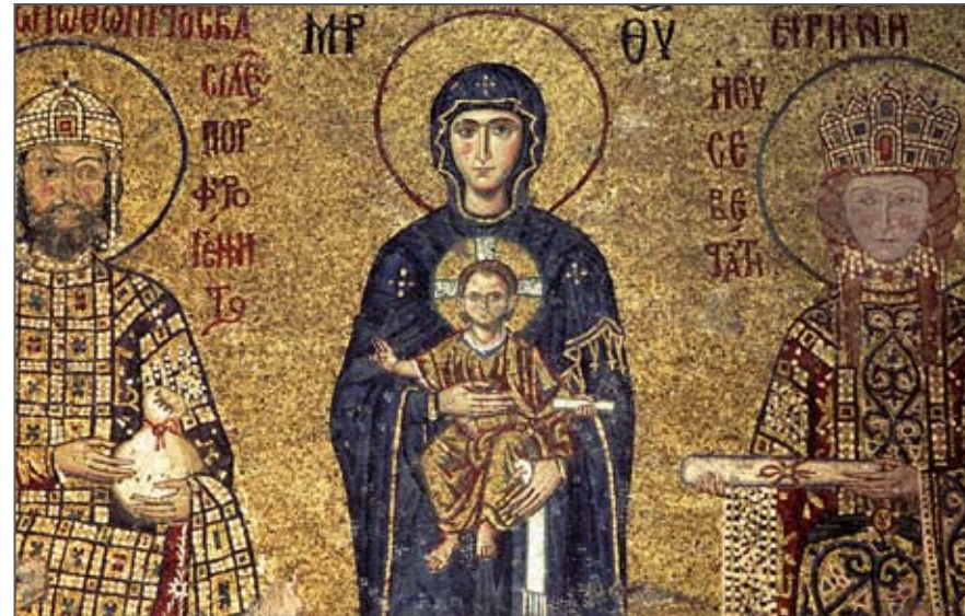
Die Hagia Sophia war aber nicht nur die größte Kirche ihrer Zeit, sie markiert auch den Beginn eines großen christlichen Reichs und den Beginn des Mittelalters überhaupt: Durch die Strahlkraft des Gebäudes wurde der Regierungsstil des

Im Jahre 521 n. Chr. ließ der oströmische Kaiser Justinian I. (482- 565 n. Chr.) nach zwei Großbränden an bereits bestehenden Kirchen in Konstantinopel auf der Brandstätte mitten in der Stadt ein riesenhaftes Gotteshaus errichten. Es sollte nach Justinians Plan die größte Kirche der Christenheit und der Welt werden, und dieser Plan sollte sich innerhalb von fünf Jahren realisieren lassen. Justinian, der Unsummen durch Weizengeschäfte mit hungernden ehemaligen weströmischen Provinzen verdient hatte, stiftete einen Großteil seines Privatvermögens und einen guten Teil der staatlichen Mittel Ostroms für dieses Projekt. Etwa 10.000 Arbeiter schufteten zwischen den Jahren 521 und 526 im Schichtbetrieb und stampften die größte Kirche aller Zeiten aus dem Boden. Sie erhielt den Namen Hagia Sophia und wurde innerhalb kurzer Zeit zu einem Symbol des christlichen Mittelalters und einem neuen Weltwunder.