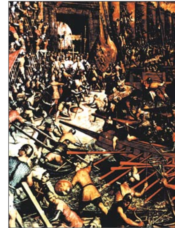
Mit der Plünderung Konstantinopels durch Kreuzritter 1204 wurde das orthodoxe Byzanz zum Lateinischen Kaiserreich unter dem Katholiken Balduin I.

11.12.1282 stirbt er in Pacormio bei Selymbria.