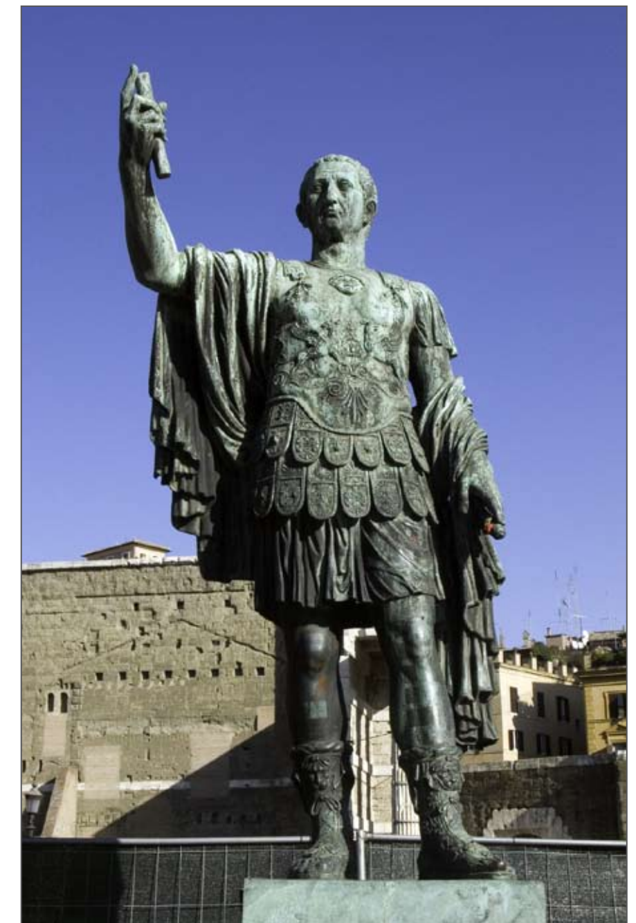
Nero als Feldherr

Seine Mutter Agrippina verlor nach und nach die Kontrolle über Nero. Durch Intrigen, Verschwörungen und Bestechungen versuchte sie Nero zu stürzen. Der Kaiser fürchtete seine Mutter und setzte eine Untersuchungskommission gegen sie ein. Agrippina konnte jedoch nichts nach-