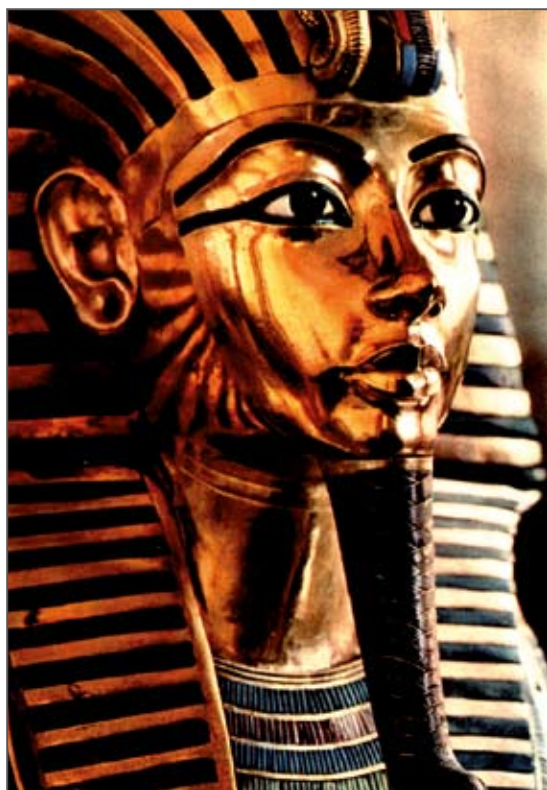
Totenmaske des Tutanchamun

Der frühe Tod des Pharao hat das Interesse und die Phantasie der Ägyptologen auf besondere Weise angestachelt. Um herauszufinden, ob